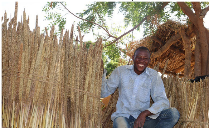
Participant du programme JASS avec sa récolte