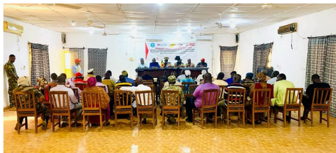
Atelier de renforcement de capacité des acteurs de la chaîne judiciaire