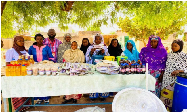
Une entreprise soutenue par JASS