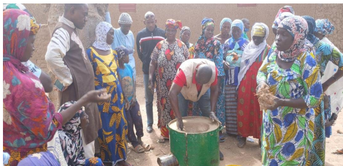
Formation sur le foyer amélioré de type Lorena