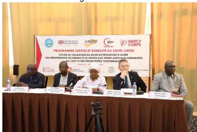
Présidium de l'atelier de validation du guide d'accès aux terres agricoles aménagées