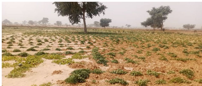
Des terres restaurées par la technique de demi-lunes